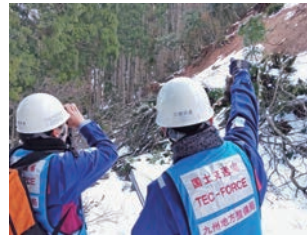
被災状況調査（砂防）

3,448名）は、道路啓開、被災状況調査、高度技術指導、排水ポンプ車・照明車・給水機能付き散水車等による応急対策支援等に当たった。度重なる災害により、被災地周辺における活動拠点の確保が困難であったため、長時間の移動を伴う、遠方を拠点とした活動となった。