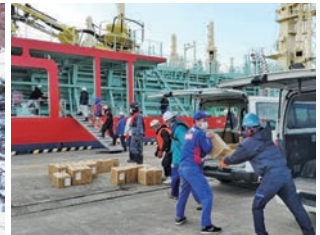
支援物資海上輸送