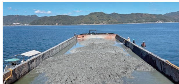
試験投入前の改質土

最適配合設計に基づき、一般的な汚濁防止膜による対策が困難な大水深かつ潮流の激しい実海域の深掘跡地において試験施工を行い、改質土による深掘跡修復施工時の環境影響低減効果を確認した上で、「浚渫土と転炉系製鋼スラグの混合材の海域利用のための技術マニュアル（環境修復版）（案）」として取りまとめた。