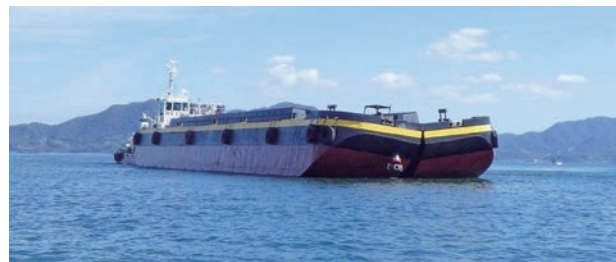
全開式土運船による試験投入状況