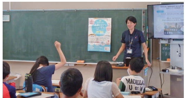
出前講座と併せて図画コンクールを展開

応募のあった学校や子どもたちからは、「楽しかった」、「インフラについて考えるきっかけになった」など、好意的な意見を多くいただいている。