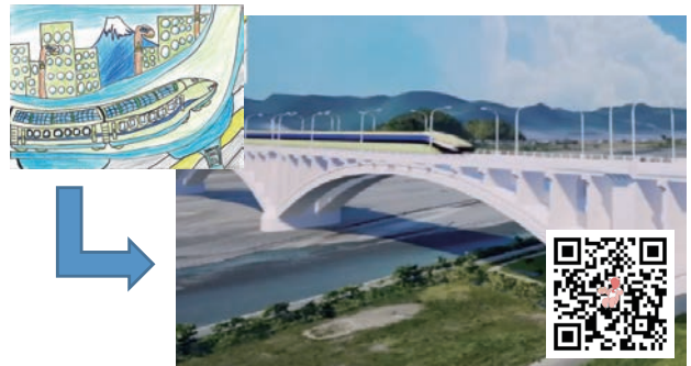
3次元点群データによる動画化

最優秀賞の作品については、静岡県の現地形を3次元点群データで表現した「VIRTUAL SHIZUOKA」内で、小中学生が描いた未来のまちが動き出す動画を作成した。また、社会インフラをカード化した「静岡どぼカード」やカレンダーを作成し、次年度の応募につなげるため、入賞者や県内小中学校に配布した。