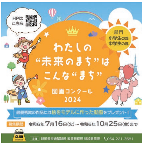
図画コンクールの募集チラシ

「わたしはこんな“まち”に住みたい」をテーマに、小中学生に身近な“まち”の未来を想像して描いてもらうことで、自分の暮らす市町、ひいては静岡県への愛着を育むきっかけとなることを期待して作品を募集した。